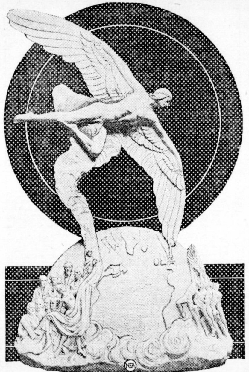
F. Vittor, sculpteur italien, vient de terminer ce monument qui sera élevé à la gloire du raid transatlantique de Lindbergh. L'emplacement de ce monument d'un style très moderne sera le champ d'aviation du Bourget à Paris.