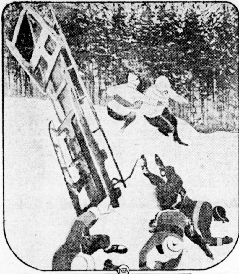
Ce remarquable instantané fut pris la semaine dernière dans les Laurentides. Il montre un grand "bob-sleigh" bondissant dans les airs après avoir heurté un banc de neige au bas d'une colline. Les cinq passagers volent de tous côtés en poussant des cris joyeux car cette catastrophe n'a rien de grave.